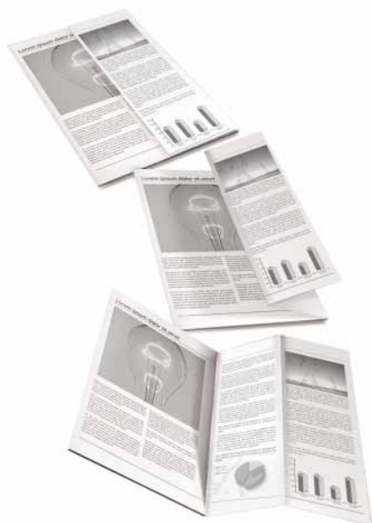
Mediante la opción de plegado en Z puede insertar cuadros y tablas A3 en un documento A4.