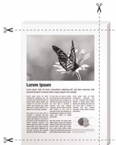
Recorte de 3 cantos (ajustable).