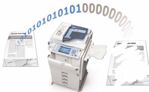
Sobreescritura de datos de disco duro

Las funciones de autenticación y encriptación protegen sus datos confidenciales. Además, las MP C2050/MP C2550 son compatibles con paquetes opcionales de seguridad como HDD Data Overwrite (Sobreescritura de datos de disco duro), Data Security for Copying (Seguridad de datos de copia), Card Authentication (Autenticación de tarjetas) y Secure Print Release (Liberación segura de impresión).